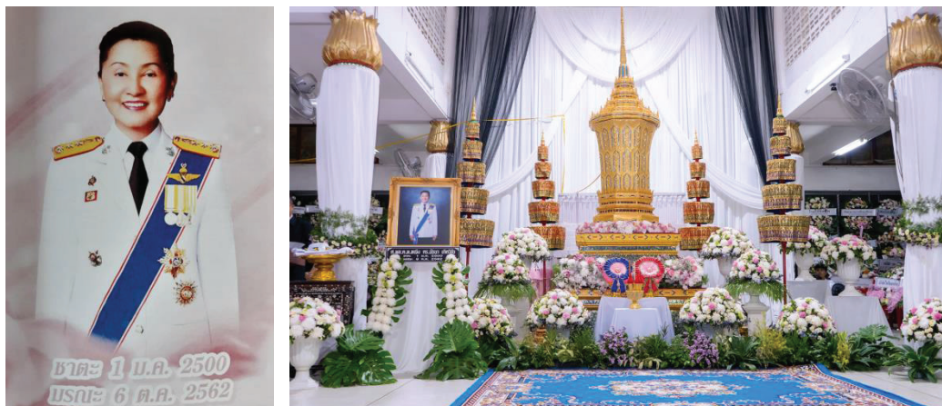
ภาพที่ 1 ภาพหน้าตรงภาพจากหนังสืองานศพ และภาพในงานบำเพ็ญกุศลศพ ระหว่าง 6-14 ตุลาคม 2562