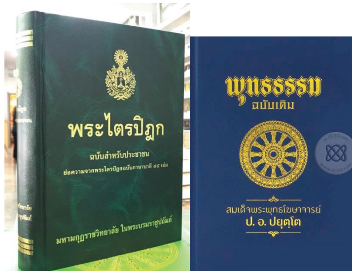
ภาพที่ 6 หนังสือพระไตรปิฎกฉบับ อาจารย์สุชีพ ปุญญานุภาพ และพุทธธรรมโดยสมเด็จพระพุทธโฆษาจารย์

(ป.อ. ปยุตโต) กัณฑ์วรรณชีวิตที่จะถูกบันทึกไว้เป็นส่วนหนึ่งของกาลเวลา (ภาพออนไลน์)