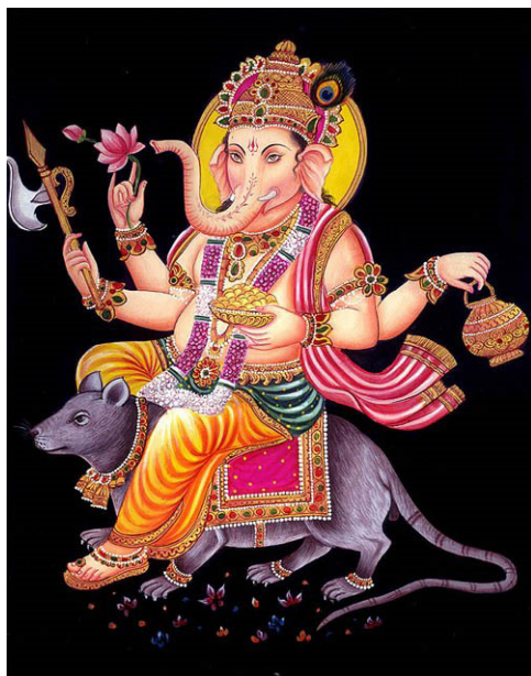
ภาพที่ 3 หนูพาหนะของพระพิฆเนศ (Lord Ganesh and the Mouse)

ดังนั้นหนูในมิติทางพระพุทธศาสนานี้ ที่ยกมาวิเคราะห์ร่วมเป็นหนูที่ใช้เพื่อการสอนธรรม สื่อธรรมเชิงเปรียบเทียบ ยกขาคกเป็นกรณีศึกษาโดยใช้หนูเป็นตัวอย่างในการสื่อ และสอนธรรม รวมไปถึงหนูที่ถูกใช้เป็นการสะท้อนคิดทางการบริหารจัดการ อันสัมพันธ์กับท่าที่และการแสดงออกดังปรากฏในขาคกและเรื่องที่น่ามาเป็นกรณีเทียบเคียงกับเหตุการณ์และกรณีศึกษาที่ปรากฏอยู่ในปัจจุบัน