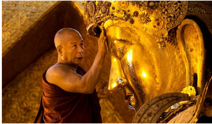
ภาพประกอบที่ 1 พระมหามัณเฑียรณ์ กับสัญลักษณ์ของอำนาจทางความเชื่อของรัฐยะไข่

รวมไปถึง “พระมหามัณเฑียรณ์” หรือ “พระมหาเม็ยะมุนี” อันมีความหมายว่า “พระผู้เป็นที่เคารพสูงสุด” หรือ “ผู้รู้อันประเสริฐสุด” ซึ่งนับเป็นหนึ่งในห้าแห่ง “เบญจมหาบุรุษสถาน” อันมีความสำคัญสูงสุดของประเทศพม่า ตำนานได้กล่าวไว้ว่า สร้างขึ้นตั้งแต่สมัยพุทธกาล โดยกษัตริย์แห่งเมืองยะไข่ องค์พระทำจากทองสัมฤทธิ์ สูง 12 ฟุต 7 นิ้ว ก่อนสร้าง พระกษัตริย์ผู้สร้างทรงพระสุบินว่า พระพุทธเจ้าเสด็จมาประทานพรให้พระพุทธรูปปฏิมาองค์นี้ เป็นตัวแทนของพระองค์ เพื่อเป็นเครื่องสืบพระศาสนาไปในภายหน้า โดยในอดีต แม้เมืองยะไข่จะถูกโจมตีโดยกษัตริย์ผู้ทรงแสนยานุภาพในหลาย ๆ ครั้ง ก็ไม่อาจที่จะเคลื่อนย้ายองค์พระมหามัณเฑียรณ์นี้ออกจากเมืองได้ ต้องมีเหตุให้ขัดข้องทุกครั้งไป จนมาถึงรัชสมัยของพระเจ้าปดุง ยกทัพมาตีเมืองยะไข่ได้ และคราวนี้สามารถอัญเชิญพระมหามัณเฑียรณ์ออกจากยะไข่ได้ โดยล่องมาตามแม่น้ำอิระวดีมายังเมืองมณฑลทะเลได้สำเร็จ พระมหามัณเฑียรณ์อันศักดิ์สิทธิ์ จึงได้ย้ายมาอยู่ที่เมืองมณฑลทะเลเป็นการถาวรนับแต่นั้นเป็นต้นมา ซึ่งนับเป็นนัยยะของการสื่อทางการเมืองที่ว่าพระพุทธรูปเป็นสัญลักษณ์ของความเข้มแข็งศูนย์รวมจิตใจ ความเข้มแข็งเกิดจากความเชื่อรวมต่อความศักดิ์สิทธิ์และการปกป้องเมือง ในส่วน of พระเจ้าปดุงการได้มา และการทำลายความเชื่อนั้น รวมทั้งความเป็นผู้มีบุญญาธิการและสิทธิ์ของการครอบครองและการได้มาย่อมเป็นสิ่งควร ดังนั้นในนิยามของพระพุทธรูปและการเมืองระหว่างรัฐจึงมีบทสรุปด้วยสงคราม การต่อสู้และการแย่งชิงดังปรากฏในกรณีของพระมหามัณเฑียรณ์เป็นต้น