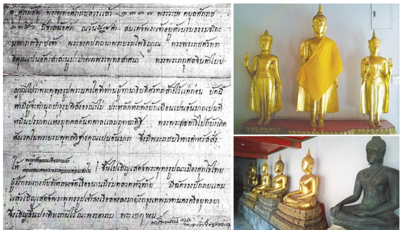
ภาพประกอบที่ 2 พระพุทธรูป และพระบรมราชโองการให้รวบรวมพระพุทธรูป (ซ้าย) กระแสพระบรมราชโองการ รัชกาลที่ 1 ให้ไปรวบรวมพระพุทธรูปจากหัวเมืองเหนือ (ขวาบน) พระพุทธรูปยืนที่จัดวางบนฐานเดียวกัน แต่มีพุทธลักษณะแตกต่างกัน ที่ระเบียงพระมหาเจดีย์ วัดพระเชตุพนฯ (ขวาล่าง)