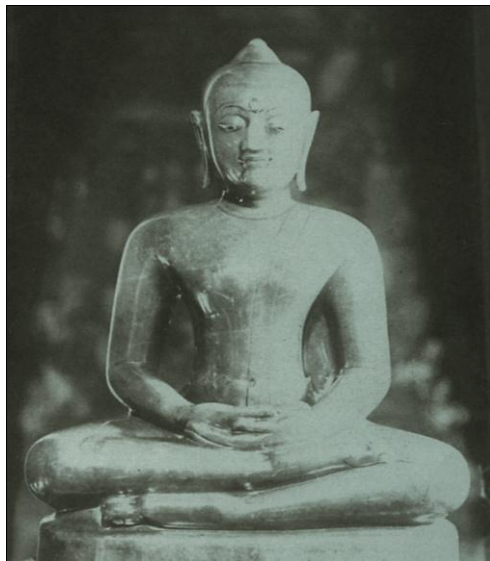
ภาพประกอบ 4 พระแก้วมรกต มรดกร่วมทางความศรัทธาของเชียงใหม่ เชียงราย ลาว และไทย (ที่มา ; พิเศษ เจียจันทร์พงษ์ และปรมินทร์ เครือทอง,บรรณาธิการ.พระแก้วมรกต. กรุงเทพฯ:มติชน.: น.68)

การเลือกเก็บรวบรวมพระพุทธรูป ทั้งจากกรุงเทพฯ และจากหัวเมืองทางเหนือ ลงมาประดิษฐานที่กรุงเทพฯ ได้แก่ พระพุทธรูปศักดิ์สิทธิ์ที่มีชื่อเสียง อาทิพระแก้วมรกต พระพุทธสิหิงค์ พระพุทธชินราช พระพุทธชินศรี และพระศรีศากยมุนี “ รัชกาลที่ 1 ใช้วัตถุทางศาสนาเป็นเครื่องมือในการแสดงตัวตนของพระมหากษัตริย์ในอุดมคติ และทำให้เมืองหลวงที่สถาปนาขึ้นใหม่มีความศักดิ์สิทธิ์ในฐานะเป็นศูนย์กลางของศาสนาพุทธ ควบคู่ไปกับอำนาจทางการเมือง ในอีกแง่มุมหนึ่งคือเป็นการสร้างความชอบธรรมของพระองค์ในทางอ้อม เนื่องด้วยปุมหลังการขึ้นครองราชย์ของพระองค์ ไม่มีความเกี่ยวข้องกับฐานอำนาจเดิมที่สืบเชื้อสายจากกษัตริย์อยุธยาอยู่เลย ดังนั้นการแสดงออกถึงการเป็นกษัตริย์ผู้มีบุญบารมีจึงจำเป็นอย่างยิ่ง...”