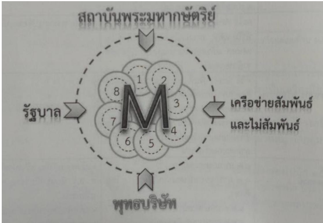
ภาพที่ 2 องค์กรอุปถัมภ์พระพุทธศาสนา