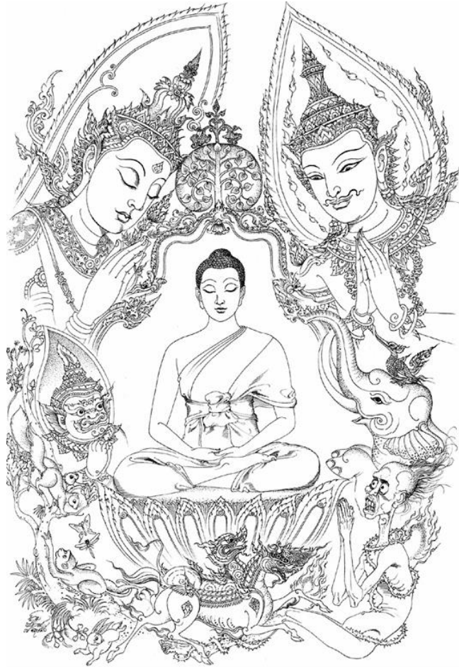
ภาพที่ 1 พระพุทธเจ้าถูกตีความว่าเป็นเจ้าอาวาสรูปแรกในโลก ที่เป็นต้นแบบทั้งในเชิงวัตรปฏิบัติ อาจารย์วัตร เป็นต้นแบบให้เจ้าอาวาสในปัจจุบัน ตามมติที่ปรากฏในหนังสือ การจัดการเชิงพุทธ 5 G Monastery Management